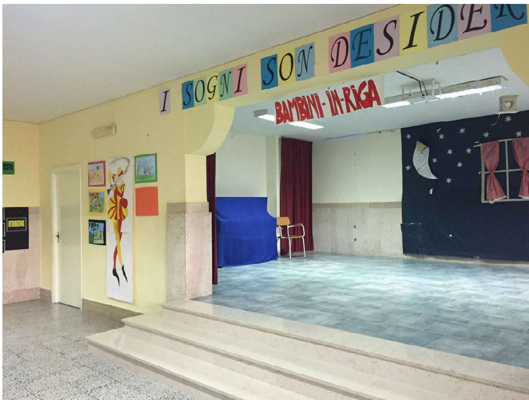
Figure 13-14: teatro