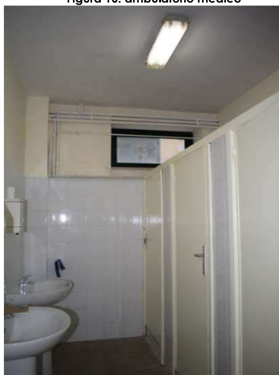
Figura 12: servizi accessori teatro