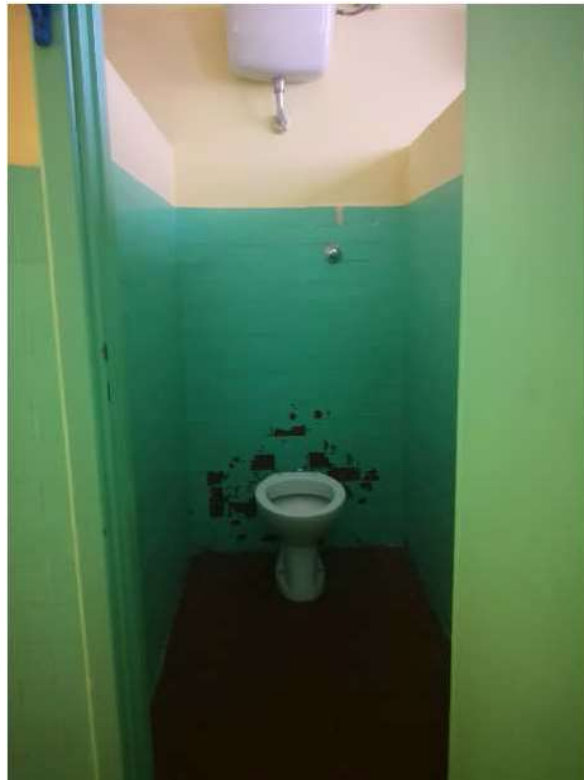
Figure 5-6-7-8: servizi accessori palestra