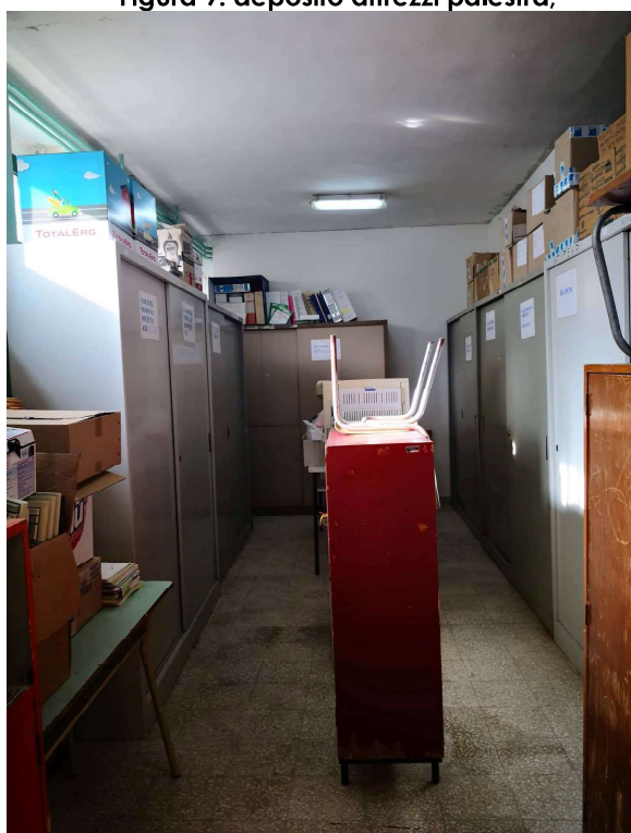
Figura 11: archivio