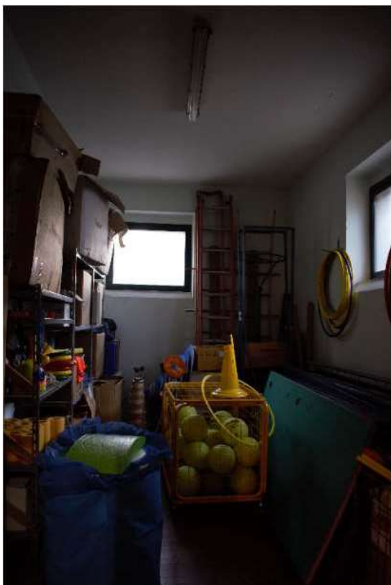
Figura 9: deposito attrezzi palestra;