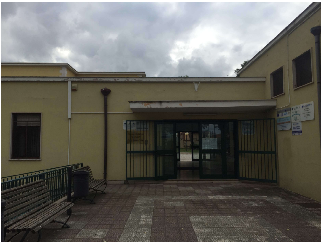
Figura 1: Ingresso Scuola A. Gabelli