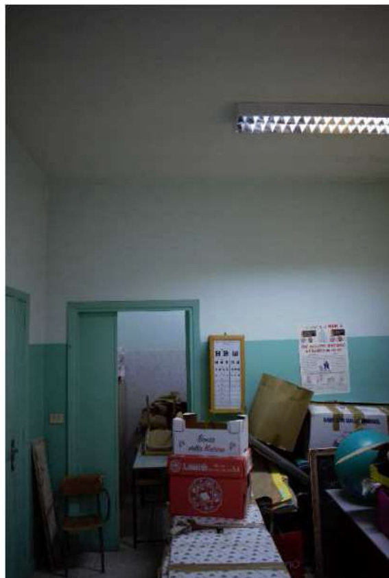
Figura 10: ambulatorio medico