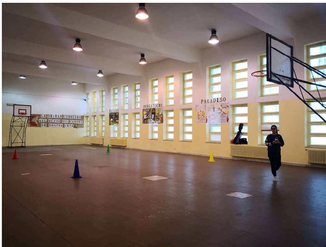
Figura 3: palestra